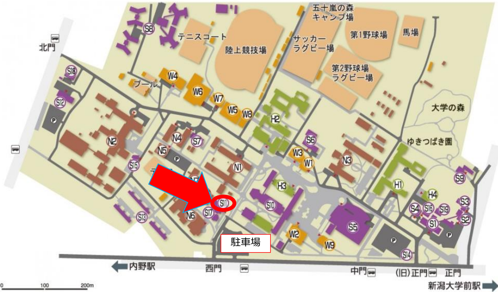
五十嵐キャンパス