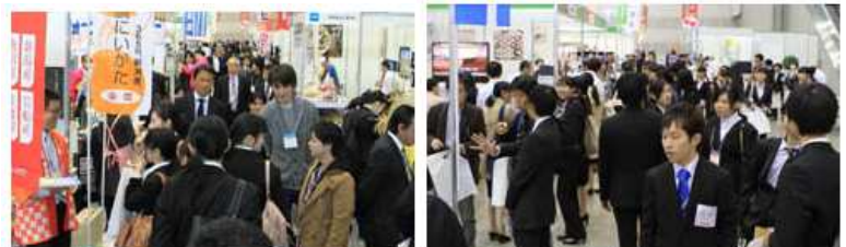
イメージ写真です

詳しくは下記URLからHPをご覧ください http://foodmesse.jp/