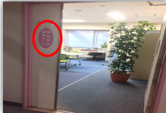
⑦学生支援相談ルームがあります