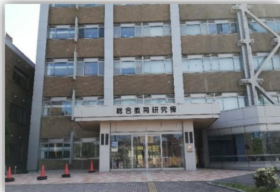
②総合教育研究棟1階入口から入ります