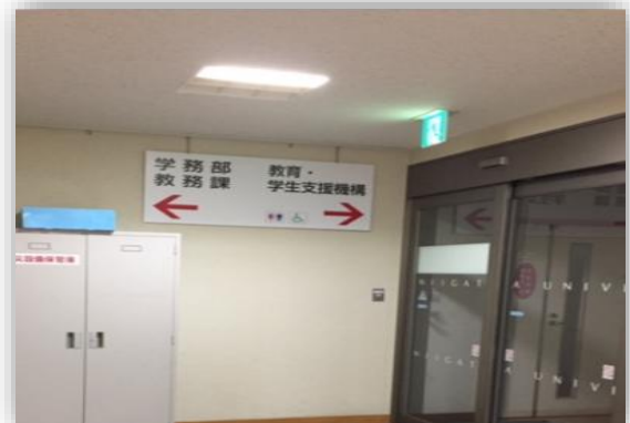
⑥自動ドアを出たすぐ左側に