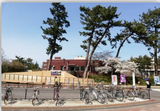
①大学生協を背にして