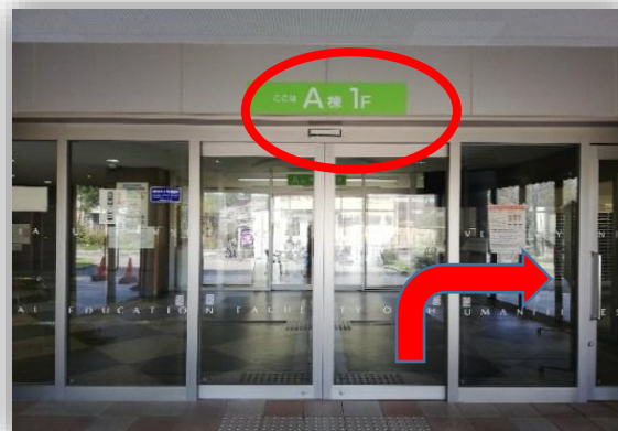
③A棟1階 入口玄関を右に