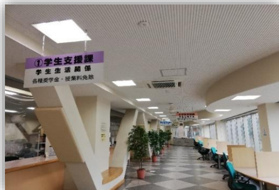
⑤学生支援課カウンターの前を通り