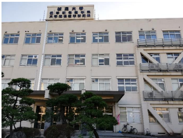
①医学部保健学科 正面玄関前から