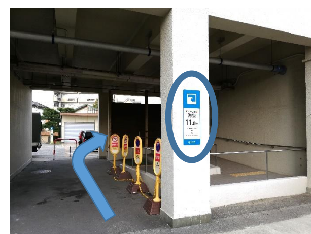
③「海拔11.0メートル」の看板の後ろに、A棟入口