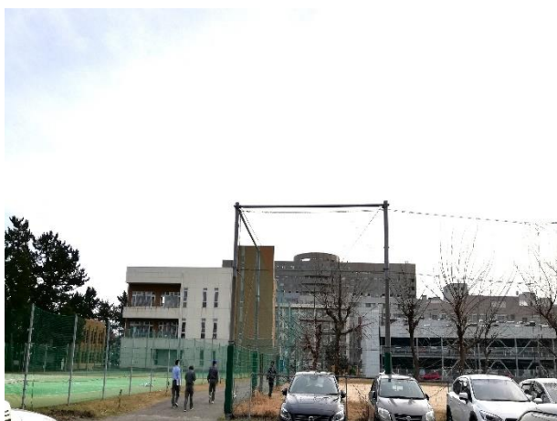
①新潟大学医歯学総合病院を背にした方向から