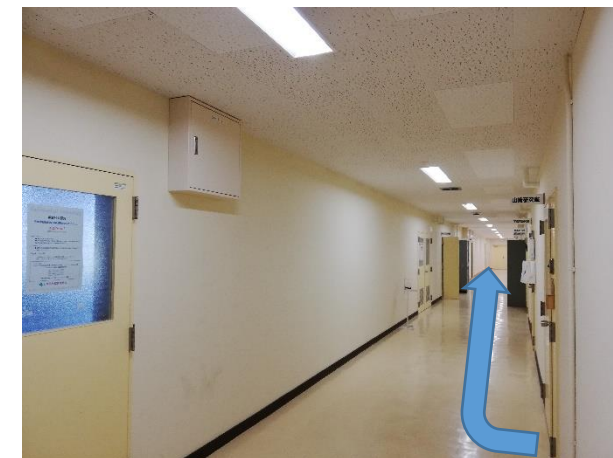
⑦エレベーターを出て右にまっすぐ、7つ目の部屋が小会議室