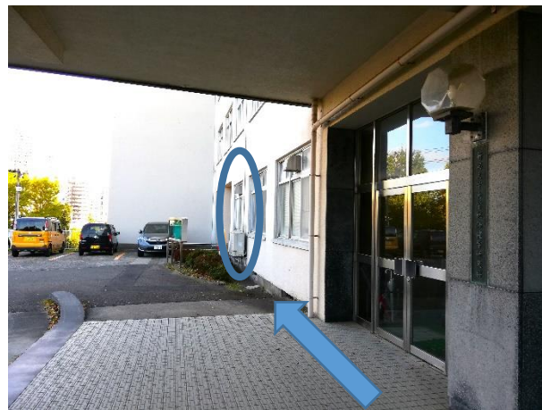
②正面玄関を、向かって左に