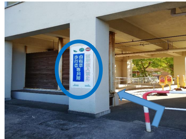
③「自転車歩行者専用路」の裏側に、A棟入口