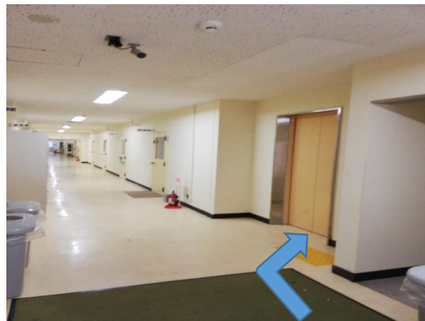
⑥入口を入れて右にエレベーター、4階に上がります