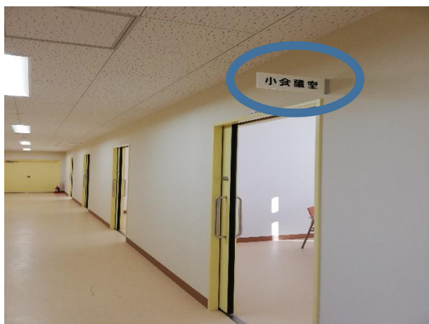
⑧小会議室（A415）があります