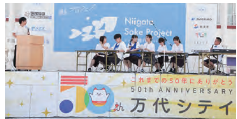
県内大学生が企画した「鮭プロフェス」。23年9月に新潟市の万代シティパークで開かれた