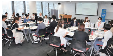
新潟市のメディアシップで23年8月に開かれた「鮭プロにいがたカフェ」。大学生と県内企業若手社員が交流した