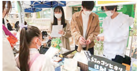
新潟県若手人材等による地域課題解決提案事業