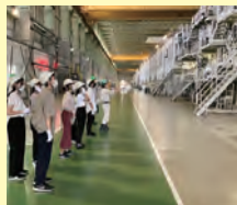
※インターンシップの様子

新潟県は創業100年を超える企業数が全国でも上位にあり、伝統の継承と時代に合わせた革新を繰り返しながら国内外で高い評価を得ている企業が多くあります。本科目は、新潟地域連携コミュニティ主催のインターンシップ体験事業 ※ を活用し、夏と春の長期休業期間に約1週間にわたり県内複数企業への訪問や社員取材を交えて実施します。新潟県内企業の魅力・強みと、それを生み出す背景や風土を深く理解するとともに、自身のキャリア観について新たな気づきを得ることもねらいとしています。